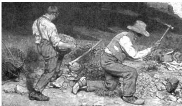
COURBET, Gustav. Os quebradores de pedra .

Os artistas atribuem à sua produção diferentes funções, atendendo a demandas pessoais e sociais. A pintura de Courbet, reproduzida acima, ilustra o conceito de arte como