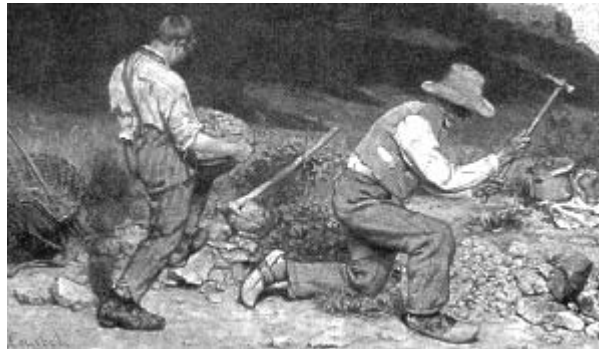
COURBET, Gustav. Os quebradores de pedra .

Os artistas atribuem à sua produção diferentes funções, atendendo a demandas pessoais e sociais. A pintura de Courbet, reproduzida acima, ilustra o conceito de arte como